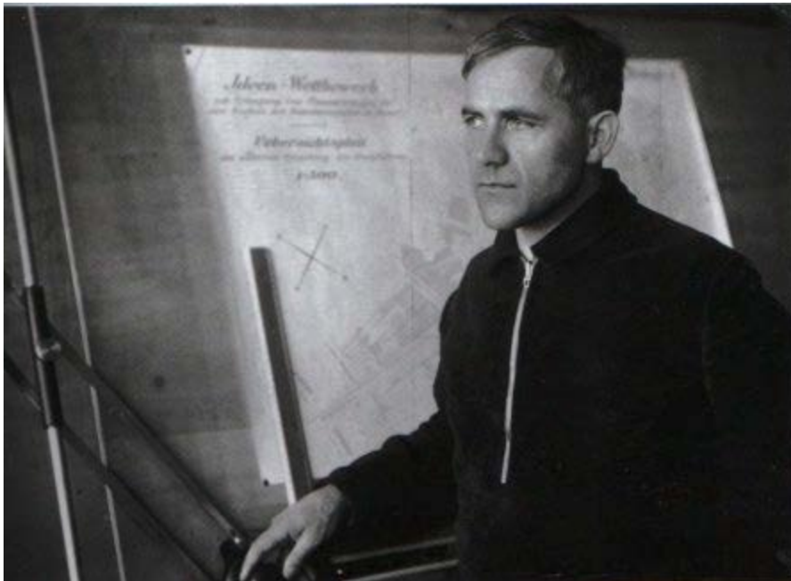
Hannes Meyer, directeur du Bauhaus, 1928

Parmi les projets proposés les plus marquants figurent celui de Le Corbusier, premier prix auquel sera finalement préférée une solution académique, et celui d'Hannes Meyer. Un architecte romand et un suisse alémanique se retrouvent ainsi projetés au cœur de l'actualité internationale. Le nouveau statut de Meyer lui vaut d'être invité par un Bauhaus au faîte de sa gloire, après son déménagement de Weimar à Dessau, à enseigner l'architecture, dès 1927. L'année suivante, il est nommé directeur de l'école.